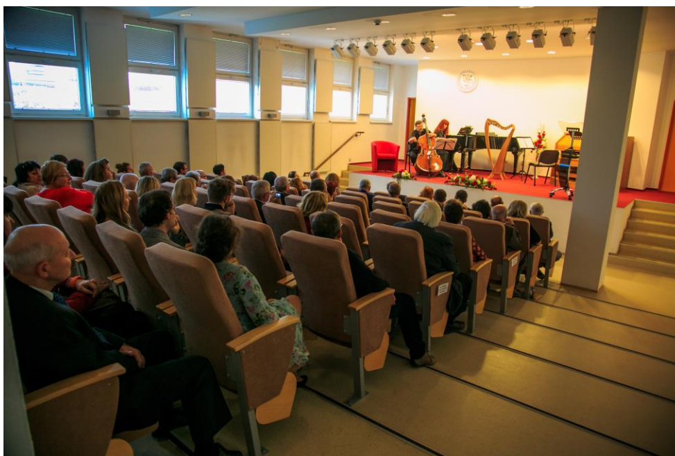
Obr. č. 2: Umelecké pásmo pri príležitosti osláv 20. výročia vzniku