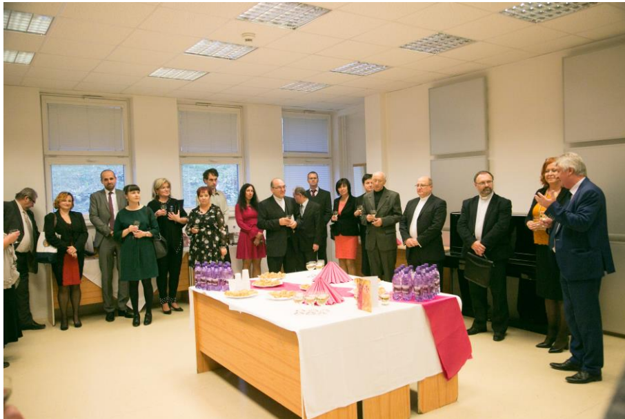
Obr. č. 3: Otvorenie Výstavy najvýznamnejších publikácií pracovníkov fakulty