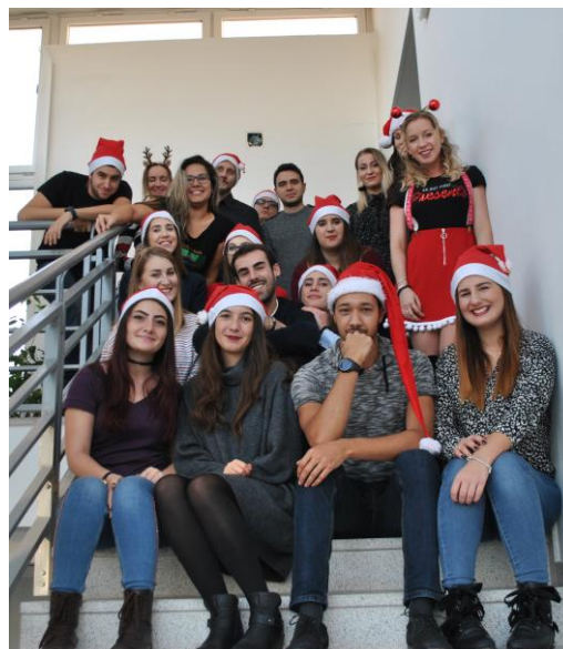
Obr. č. 6: Pre X-mas meeting