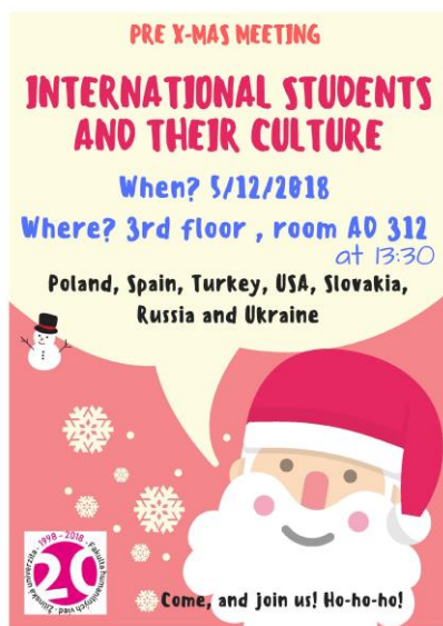
Obr. č. 5: Pozvánka na Pre X-mas meeting